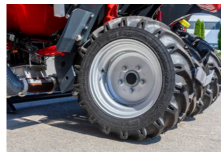
4 gumiabroncs 27 x 10 – 15,3 8PR