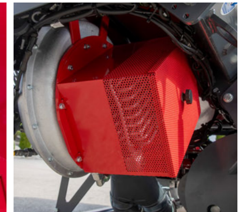
Opcionális olajhűtő a beszívott levegő felmelegítésére