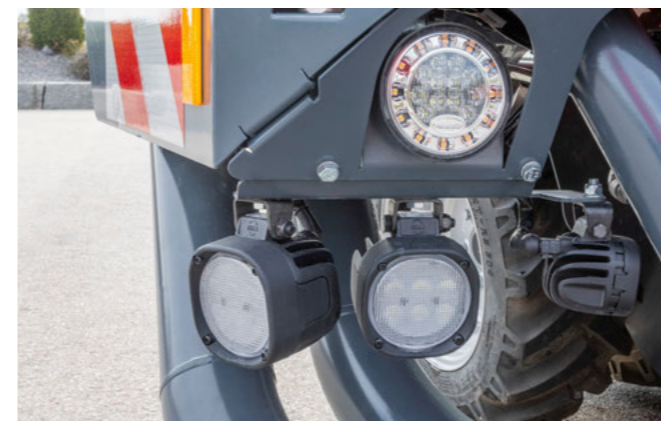
Tökéletes látás sötétben