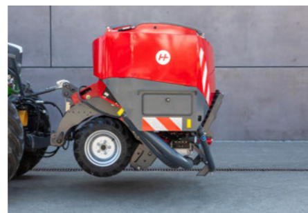
Köztes henger hidraulikus kiemeléssel közúti szállítási helyzetben