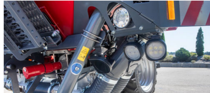
Rugalmasan forgatható LED-fényszórók