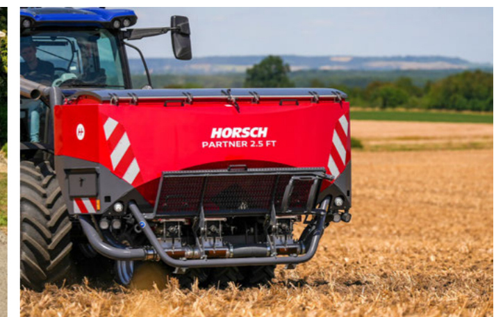
Partner 2.5 FT hidraulikus gumikerekes hengerrel