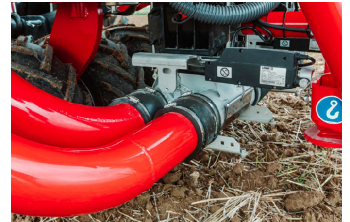
Elektromos féloldal kikapcsolás – a féloldal egyszerű be- és kikapcsolása gombnyomással a terminálon

Szériában sok gép elosztótoronnyal van felszerelve. Opcionálisan egy második elosztótoronnyal is lehetséges. Itt választhatunk egy mechanikus és egy elektromos féloldal lekapcsolás között. Egy SectionControl feloldással az egész automatizálható. Az átfedések elkerülése csökkenti a vetőmagfelhasználást és megakadályozza a túlműtrágyázást a forgóban és az sarkonál. Így a gazdálkodó egyszerűen csökkentheti a költségeket.