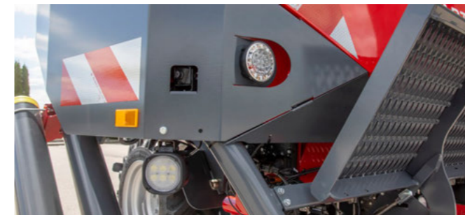
Partner FT kamerarendszerrel