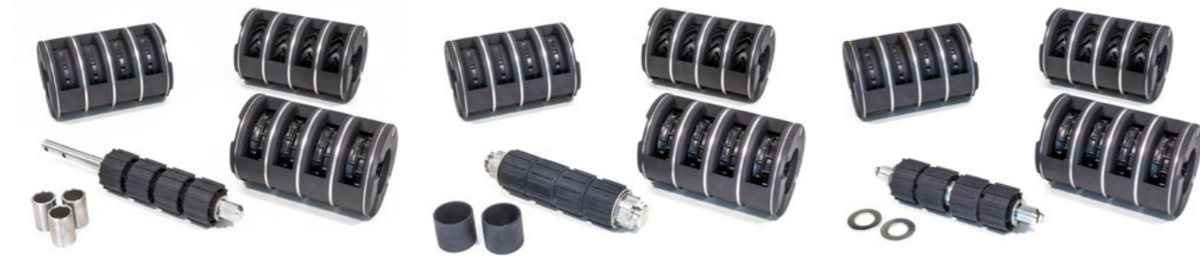
Aprómagadagoló készletek hagyományos adagolókhöz hatszögletű tengellyel