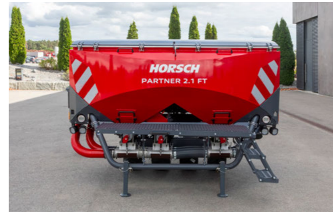
Kényelmes fellépő a maximális feltöltési kényelem érdekében