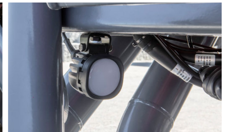
Az adagolóegység megvilágítása a kényelmes leforgatás érdekében