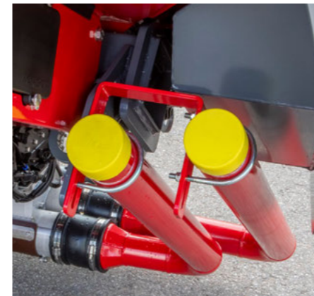
2 x 75 Ø mm levegőrendszer