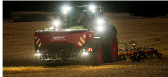
Tökéletes látás a WorkLight Pro-nak köszönhetően