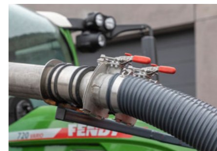
Egyszerű és szerszám nélküli kezelése a levegőcsöveknek.