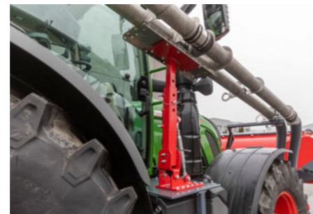
Stabil és biztonságos szerelőkar a Partner FT levegős alkatrészeihez