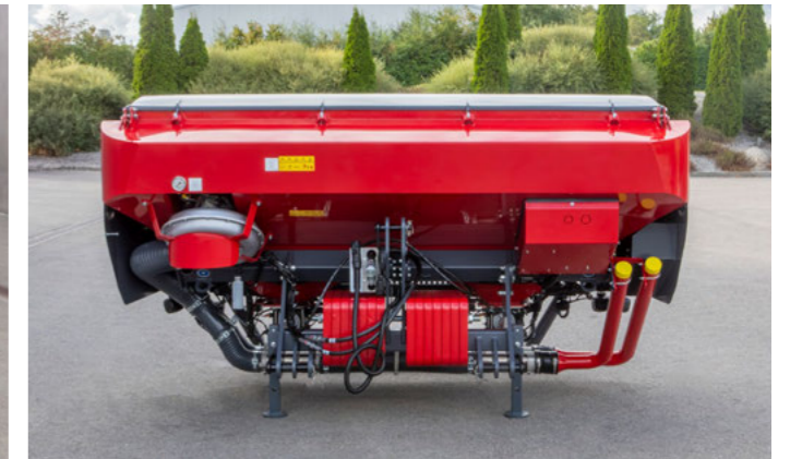
Opcionális és utólag is felszerelhető kiegészítő súlyok