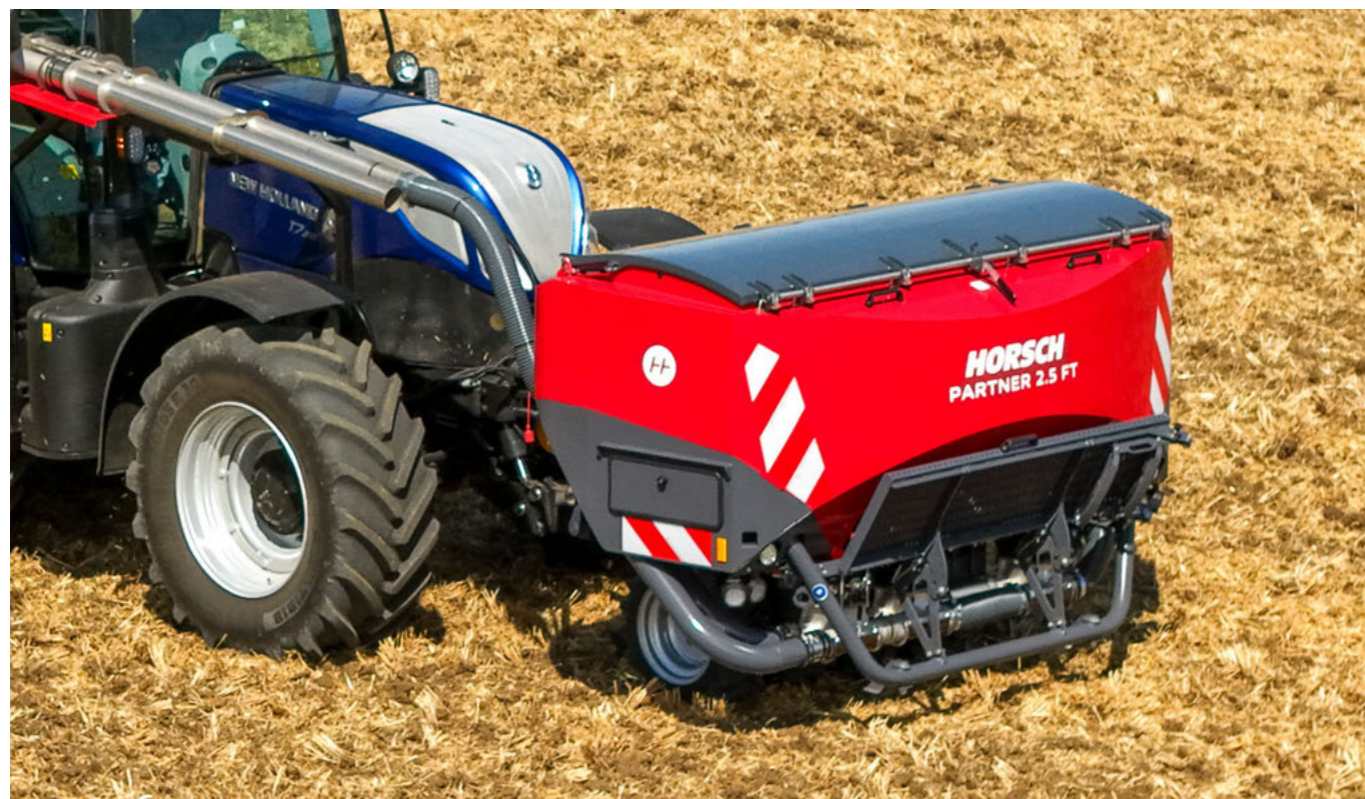
A hidraulikus henger viszi a Partner FT-t