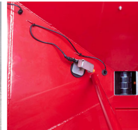
2 szintérezékelő – egy állítható magasságú a tartályban és egy közvetlenül az adagolóberendezésen