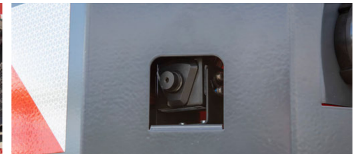
Kamerarendszer a nagyobb biztonságért