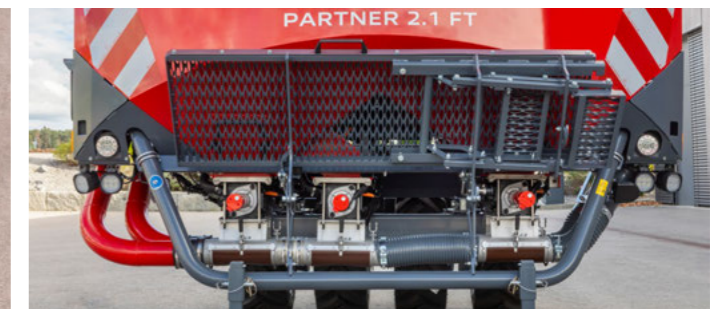
Partner 2.1 & 2.5 FT Tripla tartállyal: 3 egymástól független adagolóberendezés akár 3 komponenshez