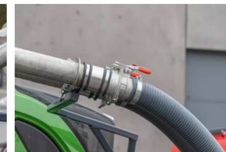
A gyorscsatlakozók megkönnyítik a gyors csatlakoztatást és leválasztást az elülső tartály, a traktor konzolja és a munkagép között.