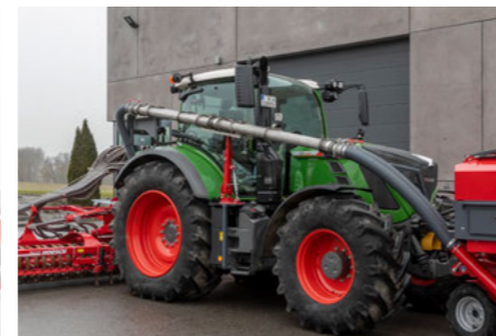
A vízszintes csövezeték-telepítés minimális kilátás korlátozást garantál.