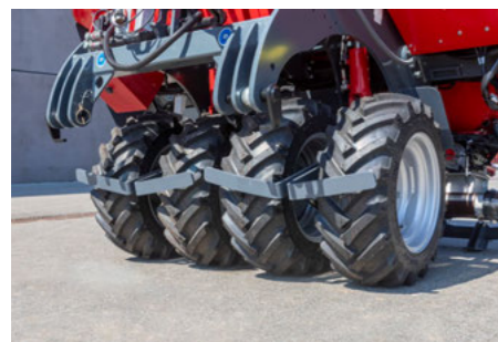
Passzívan kormányzott köztes henger hidraulikus kiemeléssel