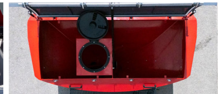
Partner 1.7 FT Duplatartály