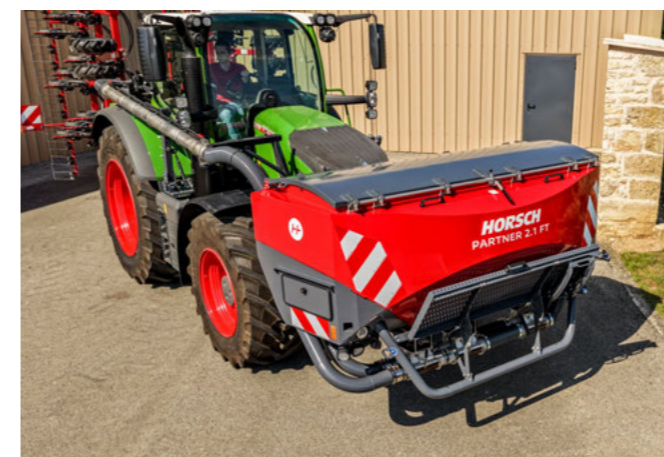
Készen áll a vetésre a Partner 2.1 FT-vel