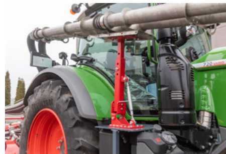
Rögzítőkészlet a levegős csövezéshez