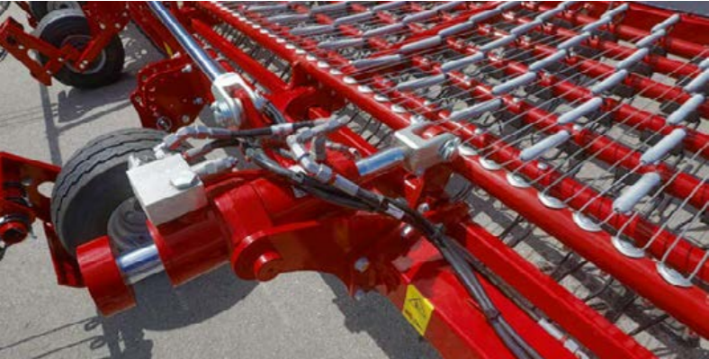
Opció: fokozatmentes beállítás skálával