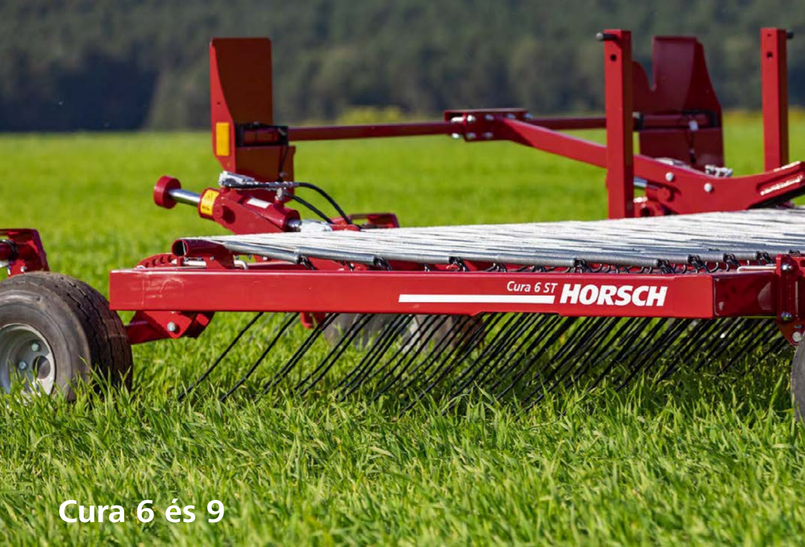
Cura 6 és 9