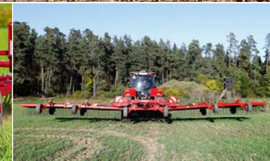
Maximális átömlés a keretmagasságnak és a keret fölötti rugóknak köszönhetően