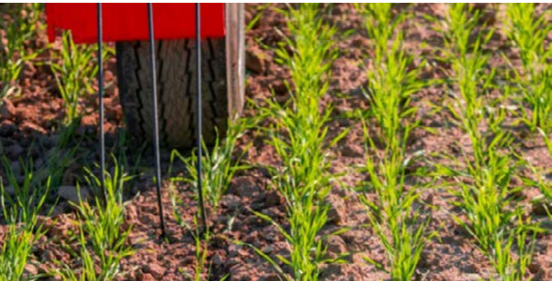
Gyomfésű a hátsó támasztókerekhez