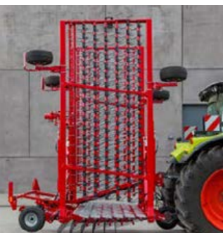
Cura 9 közúti szállítás