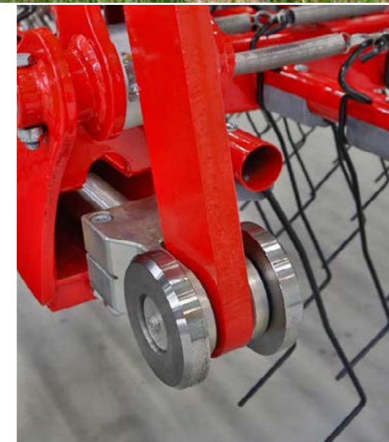
A 180°-os csukás belül elhelyezkedő munkahengere