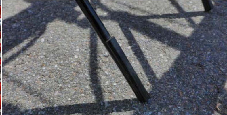
60 mm hosszú, keményfém kopóréteggel ellátott fogak