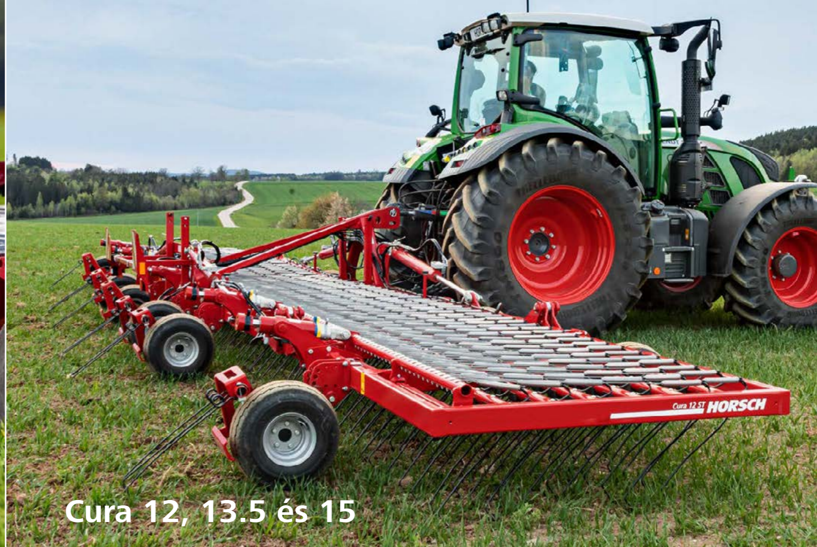
Cura 12, 13.5 és 15