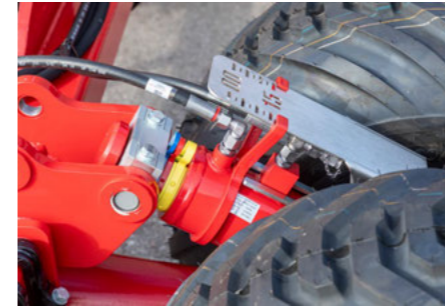
Hidraulikus munkamélység-állítás skálával