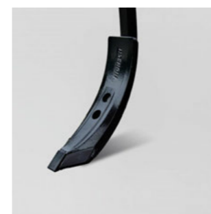
8 cm HM kapa