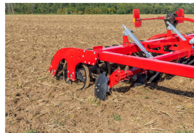
Ideális egyengetés egyengető tárcsákkal és dupla hengerrel kombinálva.