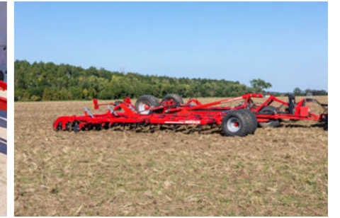
Középső támasztókerék az összes szegmens egyenletes megtartásához