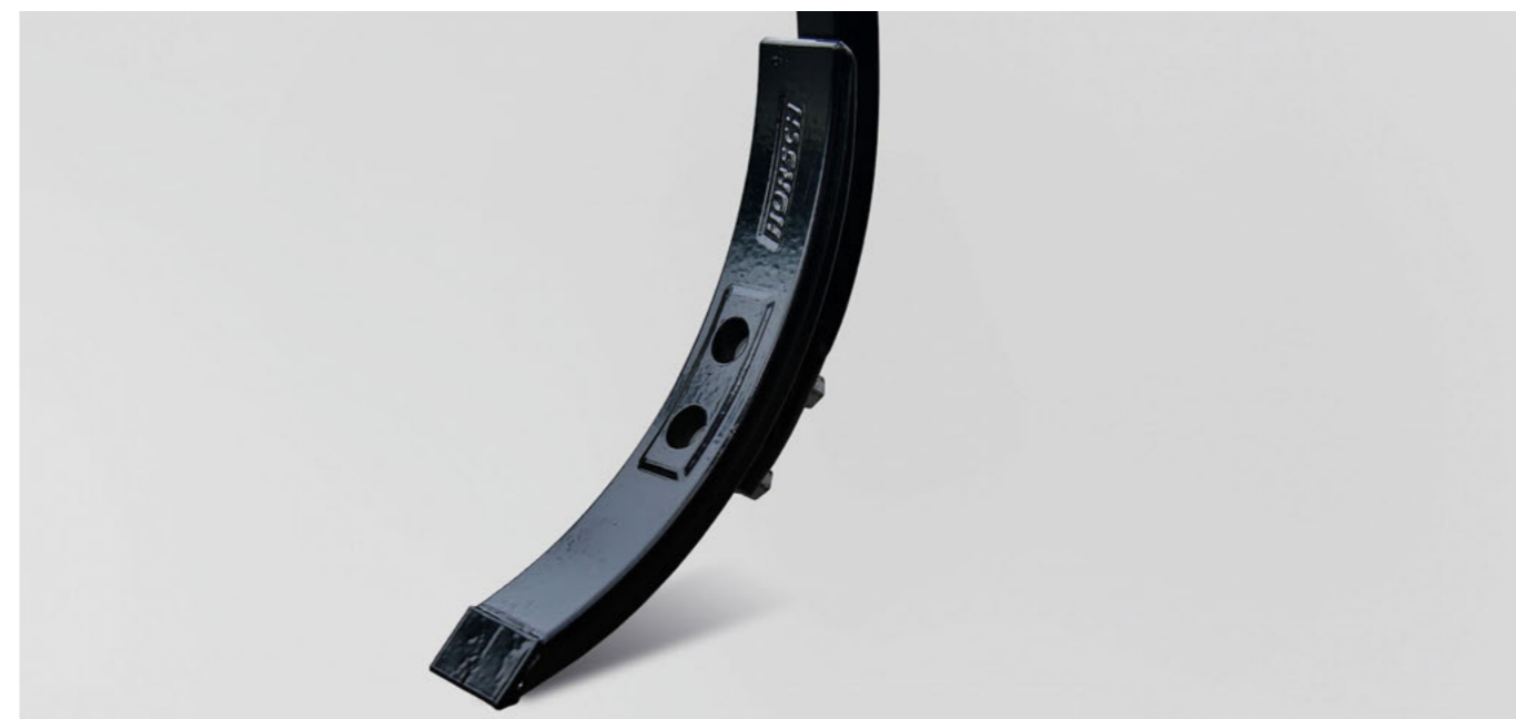
5 cm HM kapa

A Cruiser a számos kapatípusnak köszönhetően mind a tarlóhántásra, mind a maggyelőkészítésre használható. Az előfeszített HORSCH rugós kapákkal kombinálva pontos mélységtartást és az organikus anyagok ideális bekeverését eredményezi.