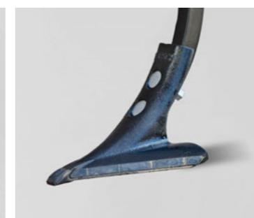
20 cm szárnyas kapa