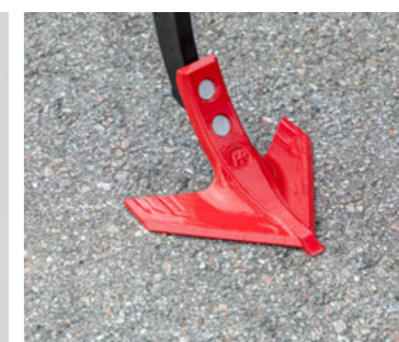
FlexCut kapa az ultra-sekély vágáshoz