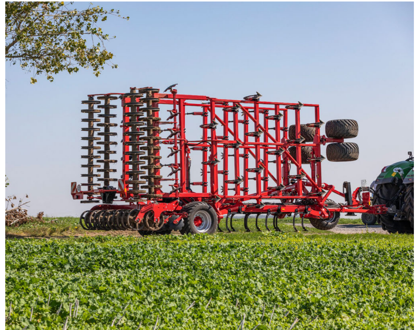
Cruiser XL közötti közlekedés során