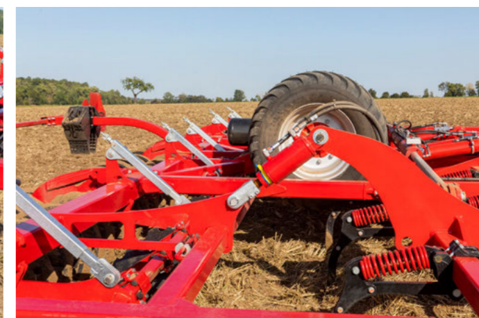
Könnyen beállítható, gyorsan alkalmazkodik