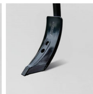
10 cm HM kapa