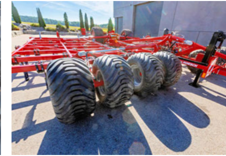
8-szoros támasztókerék-felszerelés a teljes gép előtti visszatömörítéshez