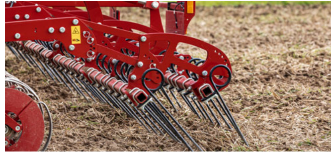
Двухрядная штригельная борона с гидравлической регулировкой агрессивности