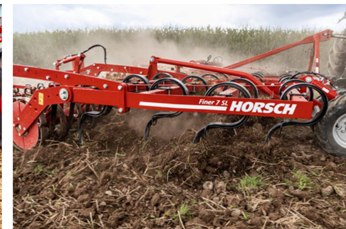
Рабочая ширина от 5 до 8 м