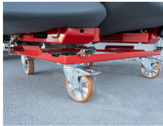
A masszív guruló-szállítókoszi megkönnyíti a fronttartály kezelését