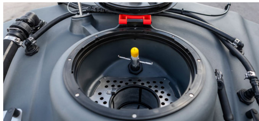
Beöntési lehetőség a tartályban kannamosóval