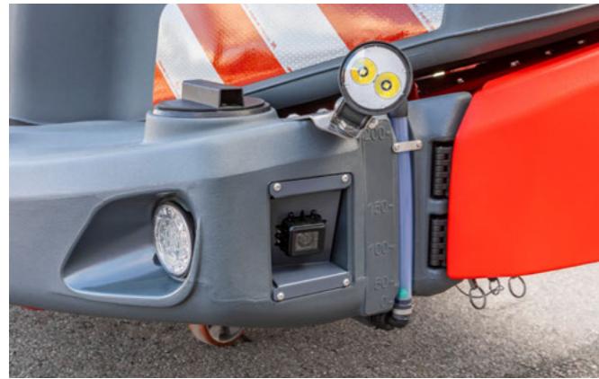
Kamerarendszer a forgalom és a terület áttekintésére