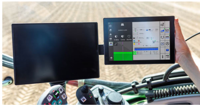
A 10"-os kijelző karcsú kialakítása lehetővé teszi a tökéletes integrációt bármely traktorfülkébe