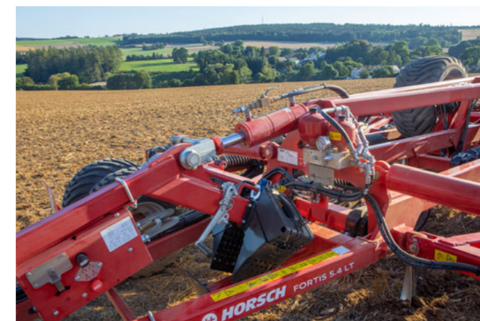
Integrált terhelésátvitel a traktor hátsó tengelyére további csatlakozási pontok nélkül