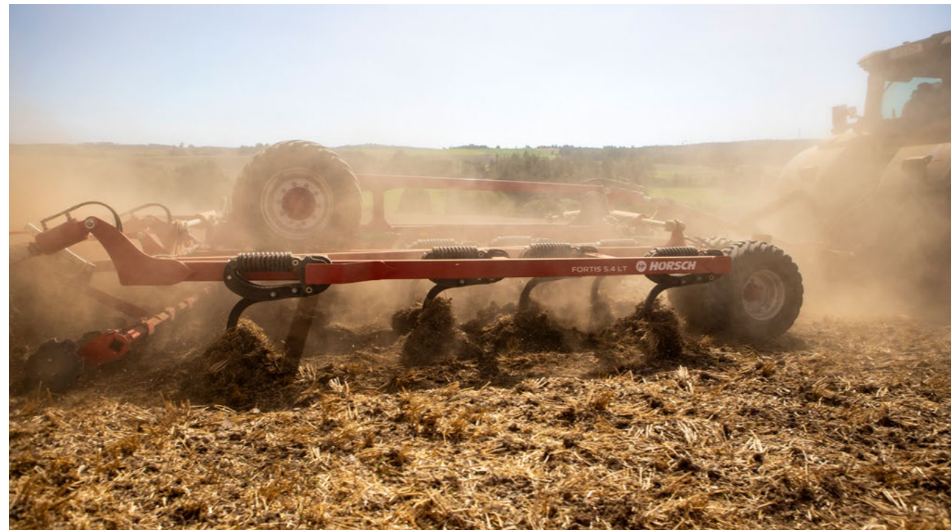
Ismert TerraGrip kaparendszer