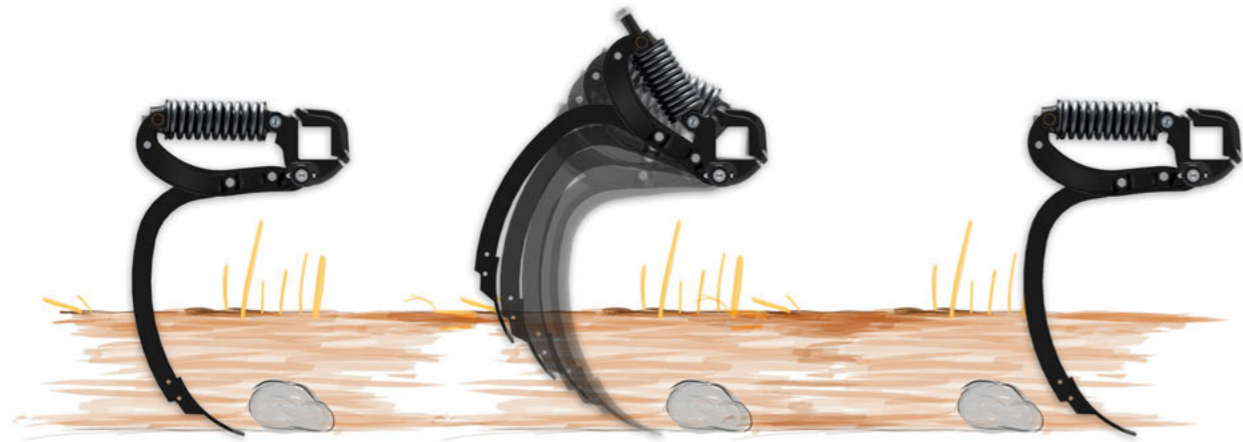
TerraGrip III - Kioldó hatás

A TerraGrip rendszer meggyőző, a variálható kopócsúcs- és szárnyválasztékával. A hajlított forma és a csúcs kis behatolási szöge miatt könnyen vontatható és nagyon jó bekeverési jellemzőket mutat.