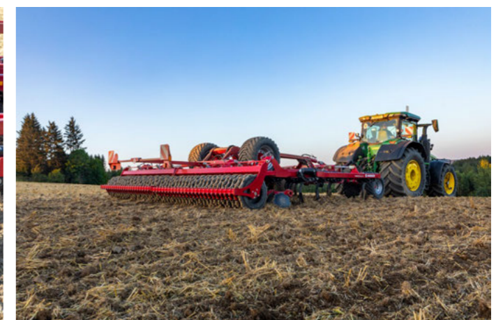
Egyes vagy dupla hengera követelmények szerint