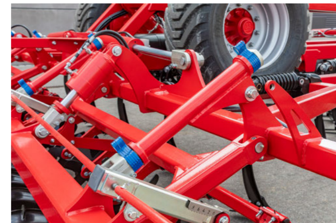
A henger szögállítás minden dupla hengerhez, hogy gyorsan reagálhasson a változó körülményekre