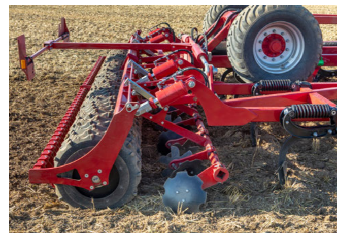
Széles választék a hengerváltozatokból

A HORSCH Fortis LT természetesen az alkalmazási feltételektől függően egyedileg igazítható az ügyfelek igényeihez és az alkalmazási feltételekhez. A gép opcionálisan rendelkezik egy integrált vonóerő-növelővel, amely akár 1,2 t támasztóterhelést átvisz a traktor hátsó tengelyére. A gép behúzó erejének egy részét arra használják, hogy a súlyt a felső munkahengeren keresztül a vonórúdra vigyék át. Szükség esetén a vonóerő-átterhelő kikapcsolható. A jól ismert MulchMix rendszer is, széles választékával a különböző kopócsúcs- és szárnyváltozatok terén, hozzájárul a rugalmassághoz. Végül a henger: Itt számos hengerváltozat közül lehet választani. A vevői igények szerint a dupla hengereket a jól ismert alumínium klipszekkel szögben lehet állítani. A szögállítással célzottan beállítható a tömörítő hengerek talajnyomása. Ez száraz talajok esetén jobb visszatömörítést eredményez és nedves körülmények között növeli a henger teherbírását.