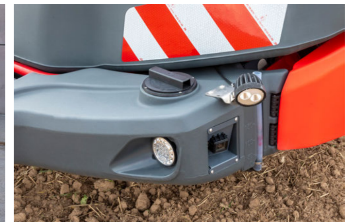
Nádrž na čistou vodu s kamerovým systémem a osvětlením prostoru před strojem