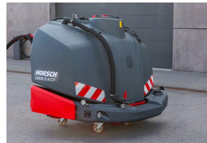
Autonomní čelní nádrž pro kombinaci se stroji z oblasti péče o plodiny, setí a hybridního zemědělství