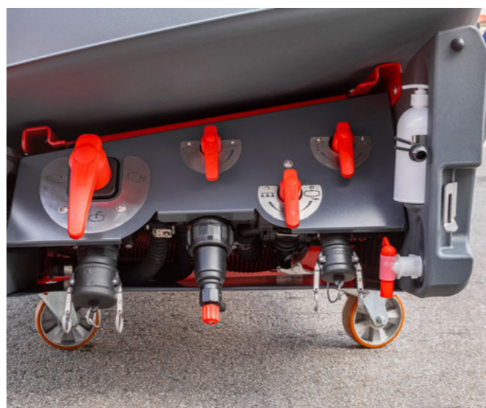
Vodní systém s hydraulickým čerpadlem a manuálními vícecestnými kohouty