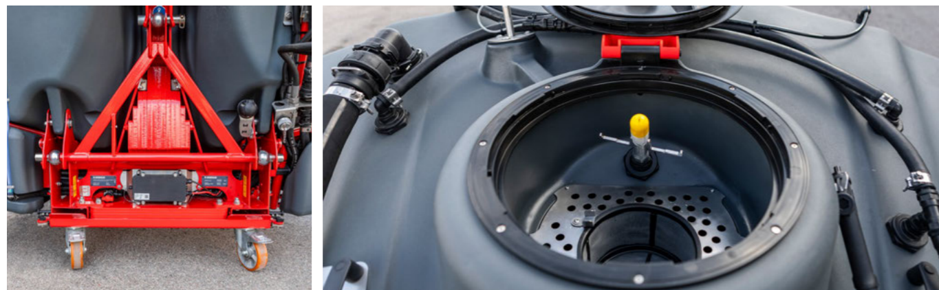
Standardní trojúhelníkový rychlozávěs pro bezpečnou manipulaci