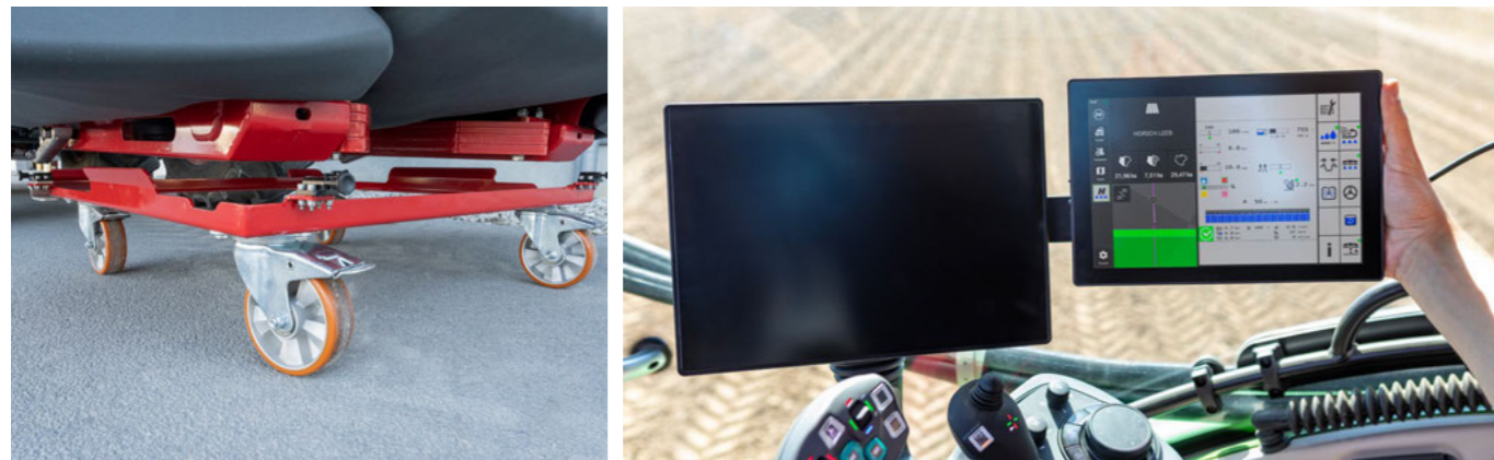
Robustní manipulační vozík usnadňuje manipulaci s čelní nádrží