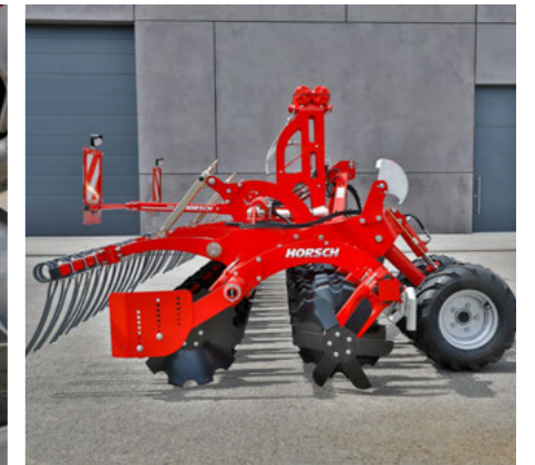
Aplikace kejdě bez pěchu, který je nahrazen branami pro minimální náchylnost k ucpávání