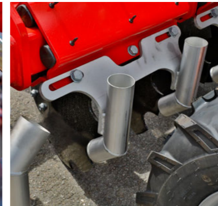
Výpustě na kejdě z nerezové oceli pro maximální životnost