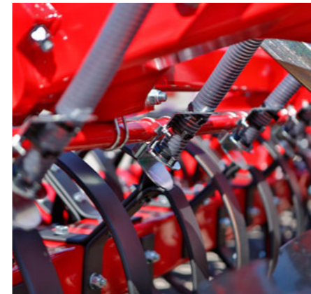
Secí lišta pro výsev meziplodin v jednom přejezdu