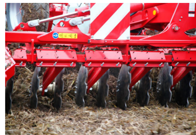
Široké zavěšení disků na rámu pro přesné vedení v půdě

V závislosti na požadavcích a spektru použití stroje může být Joker HD vybaven některou doplňkovou výbavou. Na jedné straně může být stroj vybaven secí lištou pro výsev meziplodin, nebo sadou na aplikaci kejdy pro zapravení organických hnojiv. V závislosti na vybavení traktoru si může zemědělec vybrat mezi připojením do spodních ramen kat. III, nebo IV nebo připojením do závěsu přes výkynou oj. Díky této a dalším možnostem lze Joker HD optimálně přizpůsobit požadavkům všech zemědělců. S dvojitým RollPack pěchem s průměrem 55 cm je zaručeno optimální zpětné utužení. Současně zajišťuje pěch na lehkých půdách bezpečné hloubkové vedení stroje bez hnutí hlíny. Pro silniční přepravu na silnicích je pěch vybaven podvozky. Tím je umožněna bezpečná přeprava po silnici.