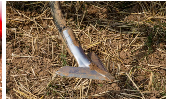
22 cm křídlová radlička pro celoplošný řez