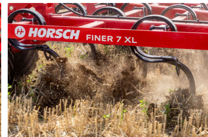
Vynikající produkce jemné zeminy