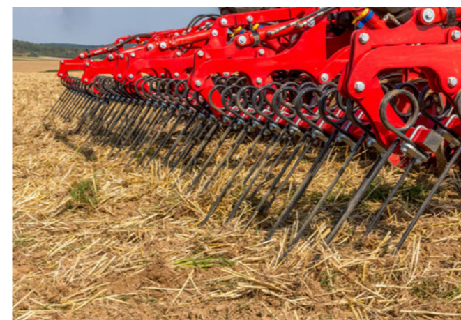
Prutové brány ukládají plevelé na povrch