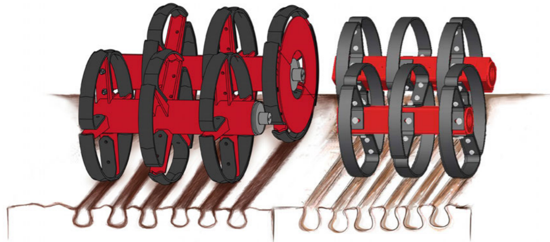
Dvojitý pěch RollFlex

Působení na jednotlivé vrstvy půdy a hlavní oblasti použití různých variant pěchů HORSCH.