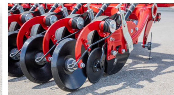
Jednokotoučová botka s odhrnovači