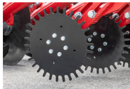
Čistící kotouč vhodný na slámu