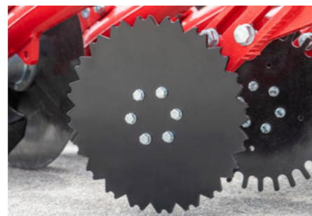
Čistící kotouč pro větší množství slámy