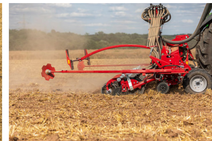
Odrhovače lze snadno deaktivovat