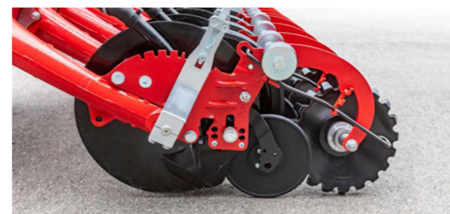
Jednokotoučová botka SingleDisc