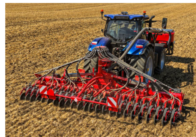
Dokonalé výsledky i v podmínkách setí do mulče

Díky 6° vychýlení a 3° odklonu secí botky se osivo ukládá pod úhlem pod povrch půdy. Podle podmínek lze volit mezi uniformerem a přítlačným kolečkem.