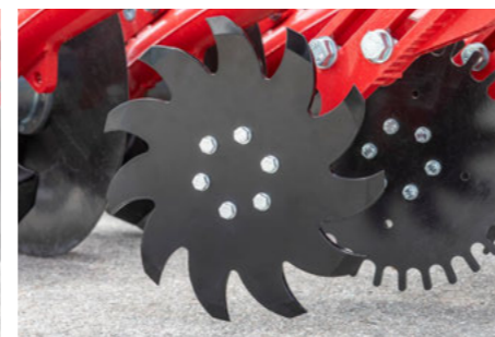
Čistící kotouč pro posklizňové zbytky kukuřice