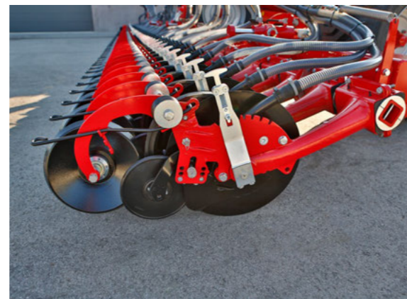
Plně zavírací kolečko i do zpracovaných podmínek