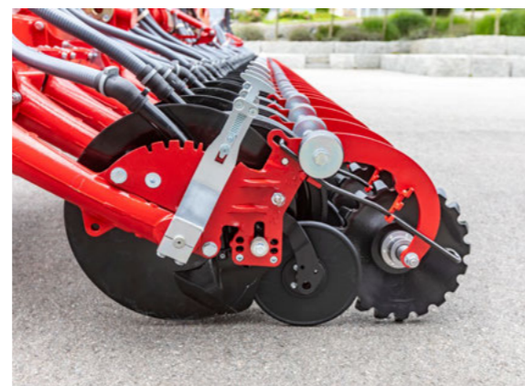
Ocelové hvězdicové kolečko vytváří jemnozrnnou půdu a uzavírá sečí řádek