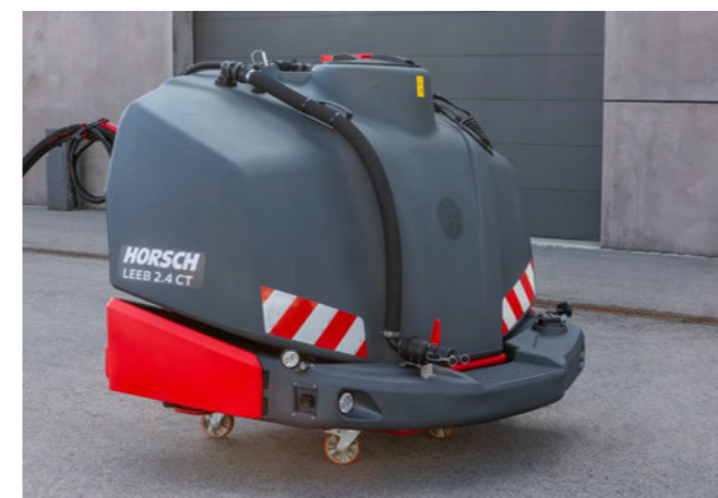
Автономний фронтальний бак для комбінування з навісним обладнанням для догляду за посівами, посіву та гібридного землеробства