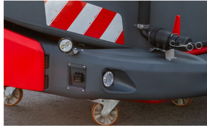
Світлодіодні робочі фари для зовнішнього освітлення