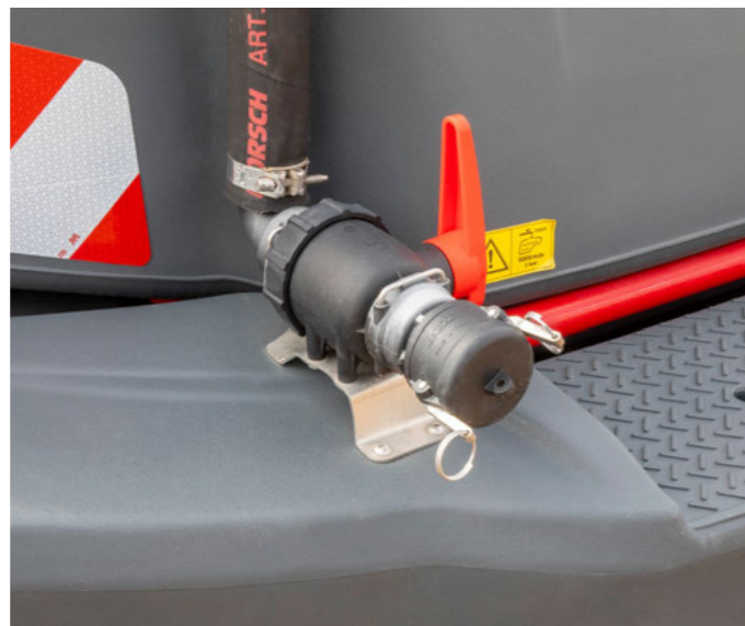
Потужне 2-дюйміве з'єднання для зовнішньої заправки

Додаткове заправне з'єднання для HORSCH Leeb CT для потужного заповнення баку для робочого розчину через напірну лінію, наприклад, через гідранти або свердловини.