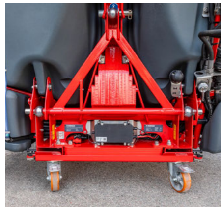
Трикутна з'єднувальна рамка в стандартній комплектації для безпечного використання