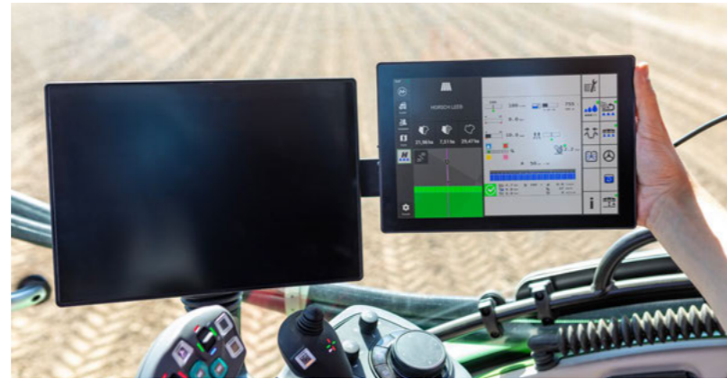
Компактний дизайн 10" дисплея дає змогу ідеально інтегрувати його в будь-яку кабину трактора.