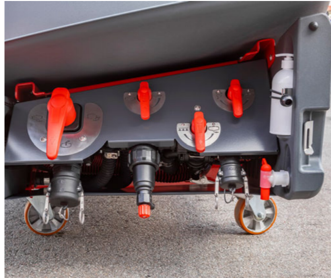
Система водопостачання з гідравлічним насосом і ручними багатоходовими кранами

У комплектії Basic HORSCH Leeb CT оснащений гідравлічним мембранно-поршневим насосом (заправний з'єднувач 2 дюйми від 5-ходового крана, 2-дюймові трубопроводи на всмоктувальній стороні). Керування з боків тиску і всмоктування здійснюється вручну за допомогою багатоходових кранів. Робочий тиск контролюється датчиком, а норма витрати робочої рідини — регулятором. Бак має електронну шкалу рівня заповнення.