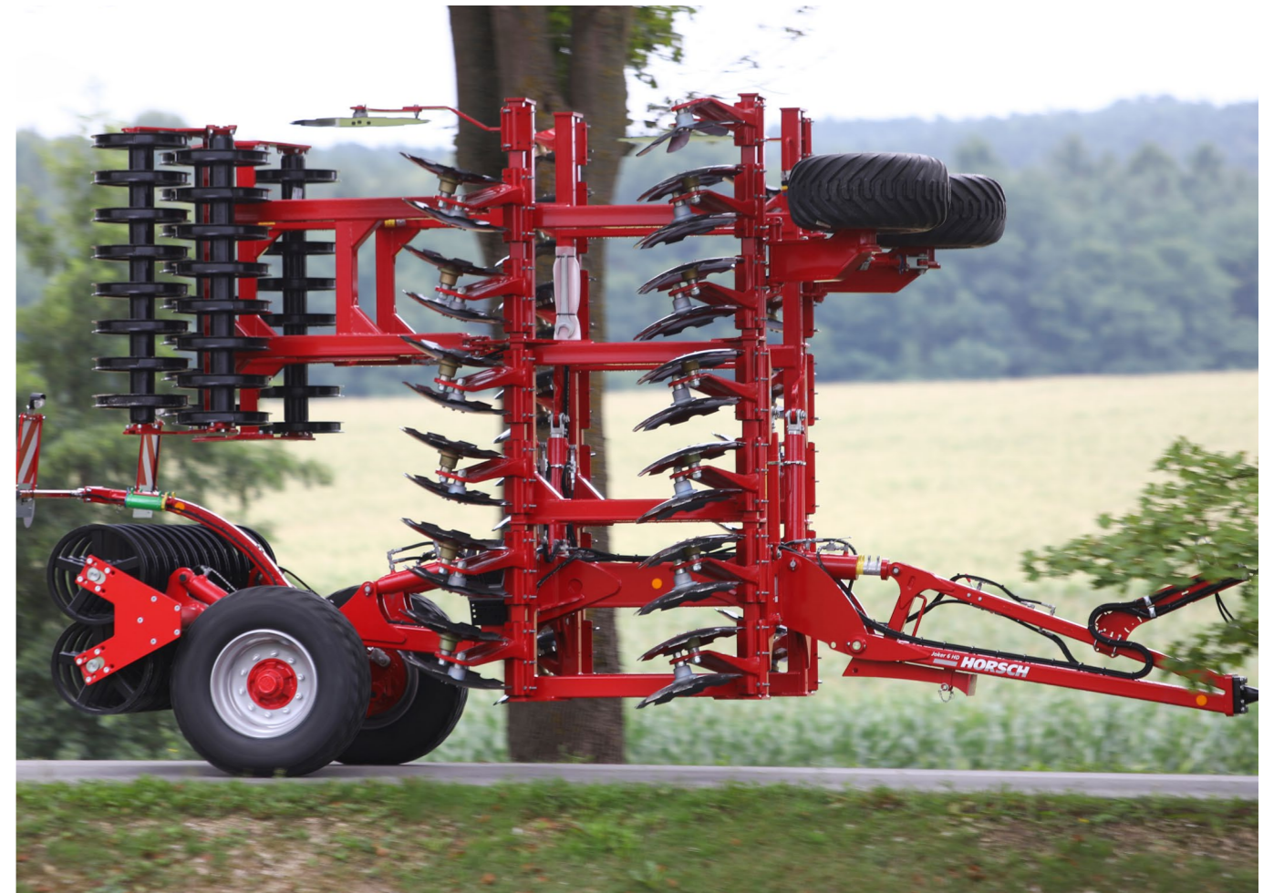
Joker HD у транспортному положенні