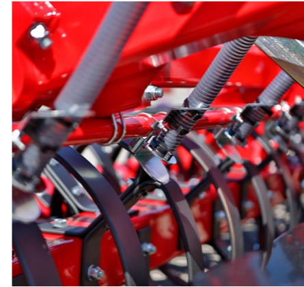
Висівна шина для сівби сидератів за один робочий прохід