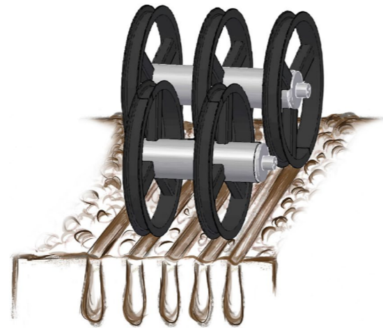
Подвійний коток RollPack