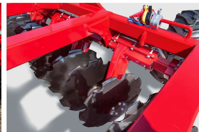
Диски великого діаметру 62 см