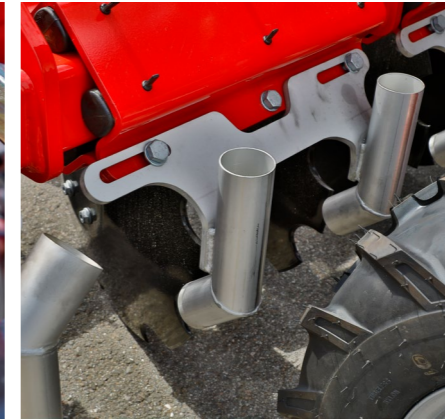
Виходи для рідкої органіки з неіржавної сталі для максимального строку експлуатації