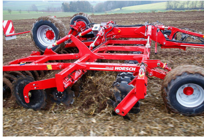
Велика відстань між дисками для максимальної прохідності машини