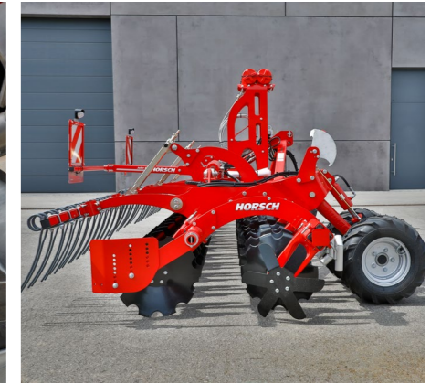
Варіант оснащення борони під комплект для рідкої органіки: без котка зі штригельною бороною для мінімізації забивання машини