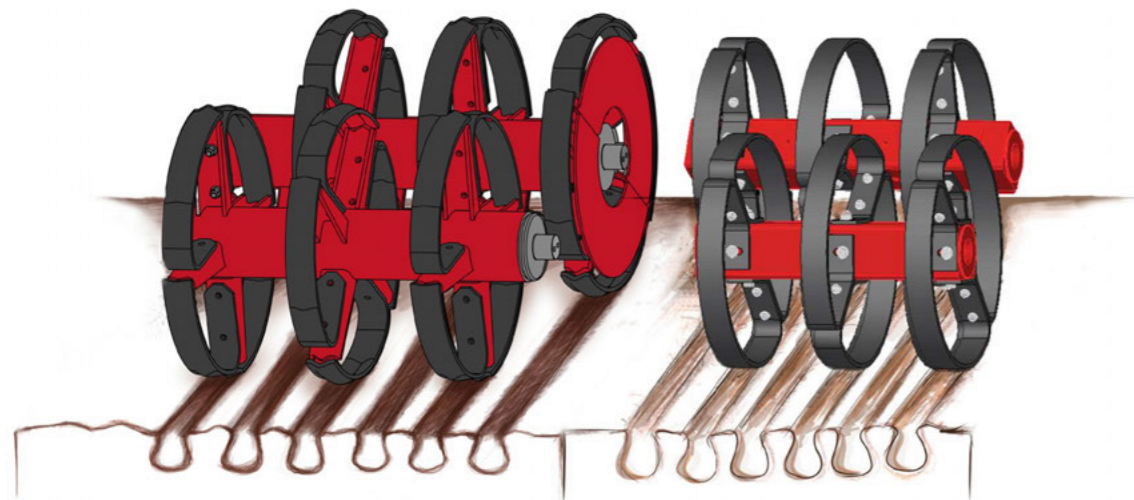
Double rouleau RollFlex Ø 60 cm

Les différents types de rouleau HORSCH, leur impact sur le sol et leur champ d'application.