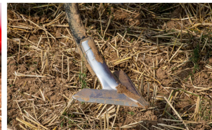
Patte d'oie de 22 cm pour une découpe sur toute la surface