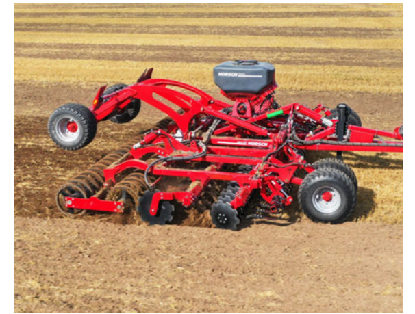
MiniDrill o microgranulador perfecto para su Joker