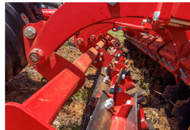
Rolo cuchilla para ayudar con altos volúmenes de paja

Dependiendo de los requisitos y la aplicación, el Joker RT puede combinarse con diferentes equipos adicionales. Puede ser equipado con una barra de semillas para sembrar cultivos de cobertura o similares. Especialmente junto con el MiniDrill, es una combinación muy eficiente. Dependiendo del equipo del tractor, el agricultor puede elegir entre un enganche de tres puntos con cat. III o VI o un enganche de barra de tiro ajustable. Debido a estas y otras opciones, el Joker RT puede ser optimizado para las necesidades de los agricultores. Los rodillos permiten adaptar perfectamente la máquina a las condiciones de trabajo. Para evitar que la máquina salte mientras trabaja en el campo, las ruedas de transporte están equipadas con un sistema de suspensión inteligente llamado SoftRide.