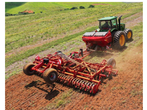
Socio HT con 2.800 l