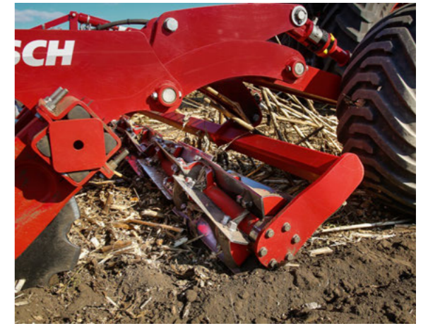
Rolo cuchilla del Joker RT