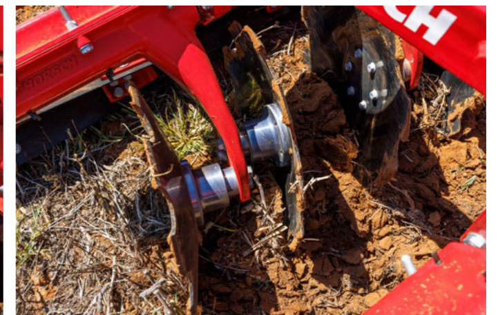
Discos dobles con ángulo fijo de 17°