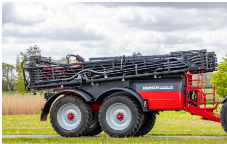
Hohe Bodenschonung mit Bereifung bis 2,19 m Ø