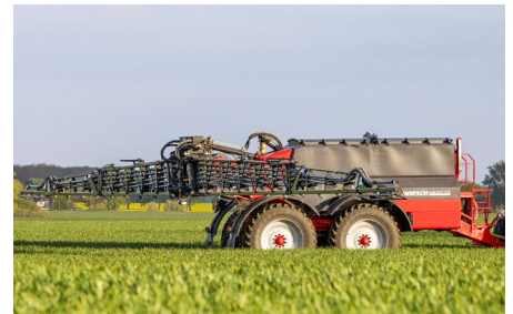
Fahrgeschwindigkeiten bis 20 km/h und Arbeitsbreiten von 36 m und 48 m