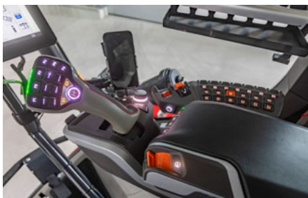
Ergonomischer Fahrhebel mit mehrfach belegbaren Tasten