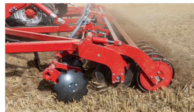
Hidraulikusan előfeszített henger