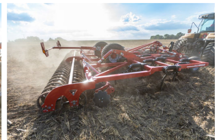
Tökéletes egyengetés a kompakt felépítés révén