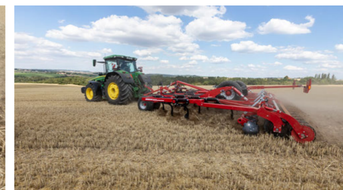
SteelFlex henger hidraulikusan előfeszített RingFlex-szel