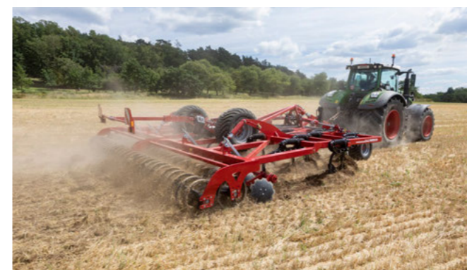
Merev hengertartó dupla RollPack hengerrel