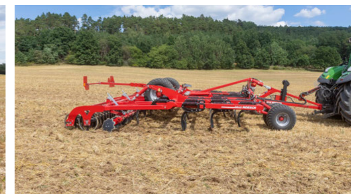
Merev hengertartó dupla hengerrel