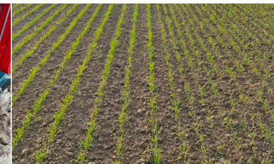
Dos distancias entre hileras en una sola máquina gracias a la manguera selectiva