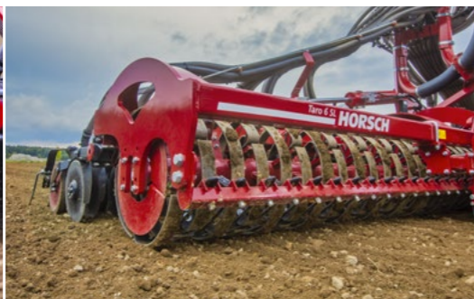
El compactador RollFlex realiza el control de la profundidad y produce tierra fina