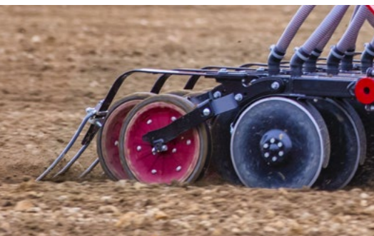
La reja de siembra TurboDisc de tercera generación permite una colocación precisa de las semillas