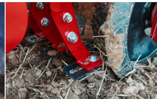
El compactador de anillos trapezoidales opcional garantiza una consolidación óptima