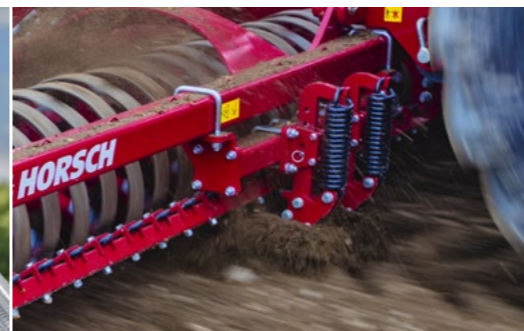
Las dientes del borrahuellas levantan las huellas