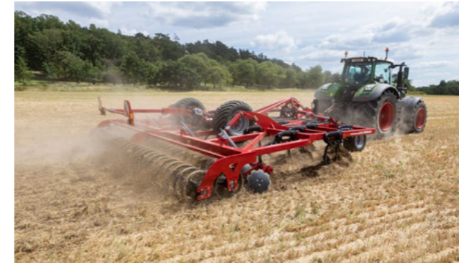
Pevný rám pěchu s dvojitým RollPack pěchem