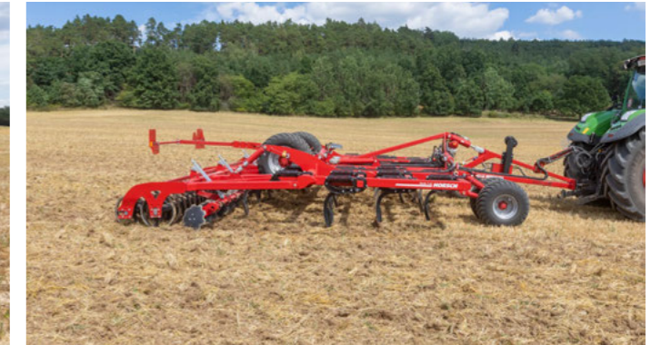
Pevný rám pěchu s DoppelPacker pěchem