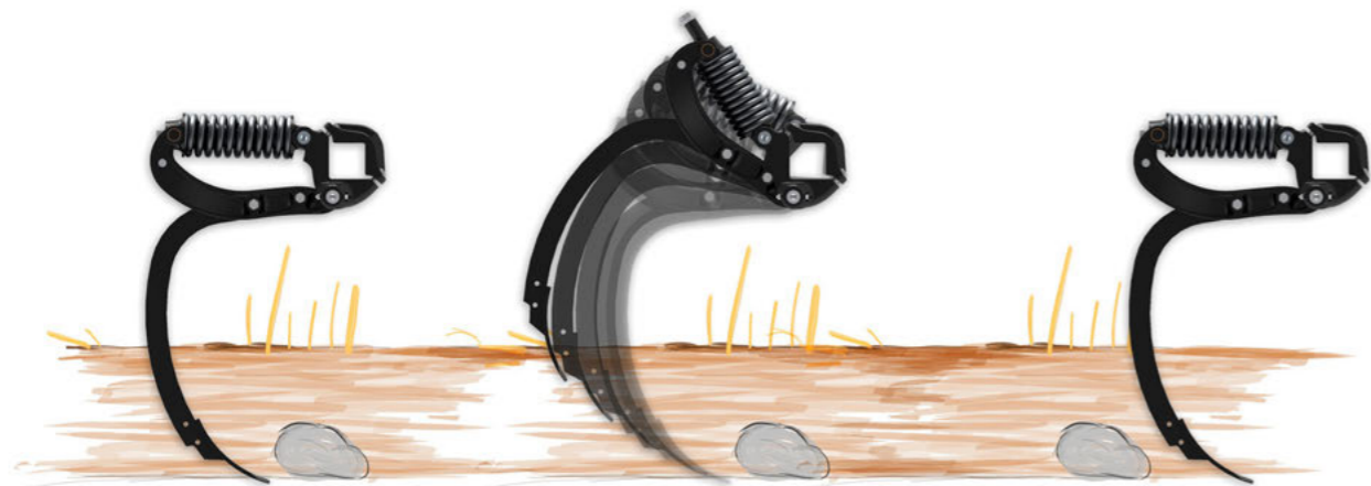
TerraGrip III – jistění

Systém slupic TerraGrip vyniká svou flexibilitou při výběru radliček a křídel. Díky zakřivenému tvaru a malému úhlu stoupání na špičce radličky se vyznačuje nízkým tahovým odporem a intenzivním mícháním.