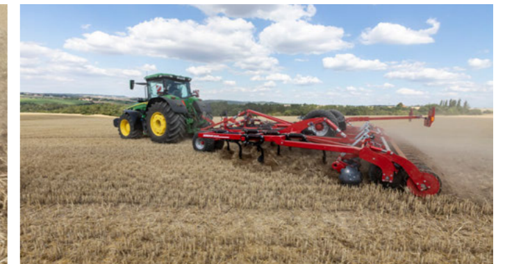
SteelFlex pěch s hydraulicky předepnutelným RingFlex pěchem