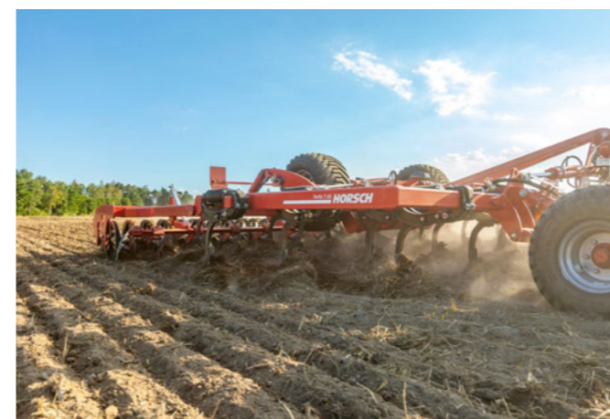
Fortis AS při základním zpracování půdy

V závislosti na podmínkách použití může být HORSCH Fortis AS samozřejmě individuálně přizpůsoben potřebám zákazníků a podmínkám použití. Stroj je standardně vybaven integrovaným posilovačem trakce, který přenáší až 1,2 tuny zatížení na zadní nápravu traktoru. Část nosníku stroje se používá k přenosu hmotnosti přes hydraulický válec na oj. V případě potřeby lze samozřejmě posilovač trakce vypnout. K flexibilitě přispívá také známý MulchMix systém se svou širokou nabídkou variant radliček a křídel. Nakonec pých: Zde lze vybírat mezi třemi variantami pýchů. Z dvojitých pýchů je k dispozici známý SteelFlex pých a dvojitý Rollpack pých. Podle přání zákazníka mohou být dvojitě pých hydraulicky předepínatelné. Předpětím lze zabránit propadání prvního pých a tím zvýšit únosnost. Z jednoduchých pýchů je k dispozici OptiRoll pých s velkým průměrem 73 cm. Vyznačuje se vysokou nosností i na lehkých půdách a vysokou průchodností mezi gumovými kroužky.