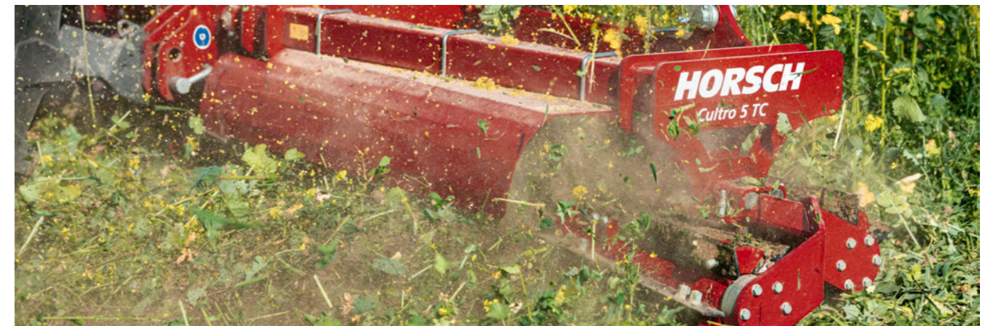
Подвійний ножовий коток для ідеального подрібнення