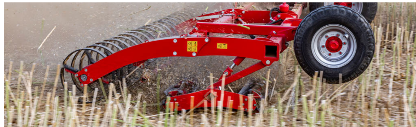
Опційно з котком для рівномірного ущільнення ґрунту