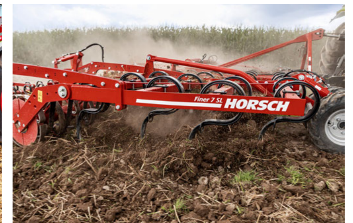
De 5 à 8 mètres de largeur de travail