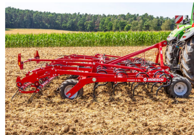
Avec rouleau ou roues de support arrière