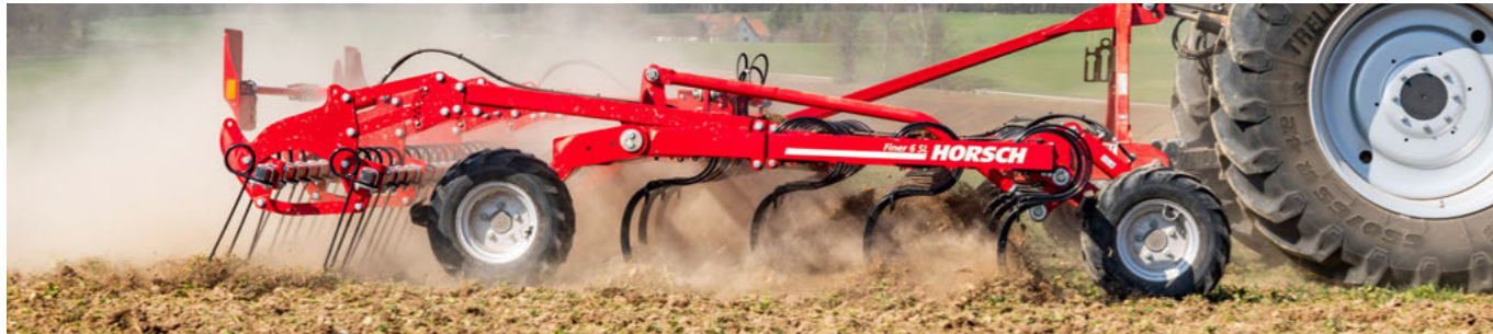
Roues de support à l'arrière en option au lieu du rouleau