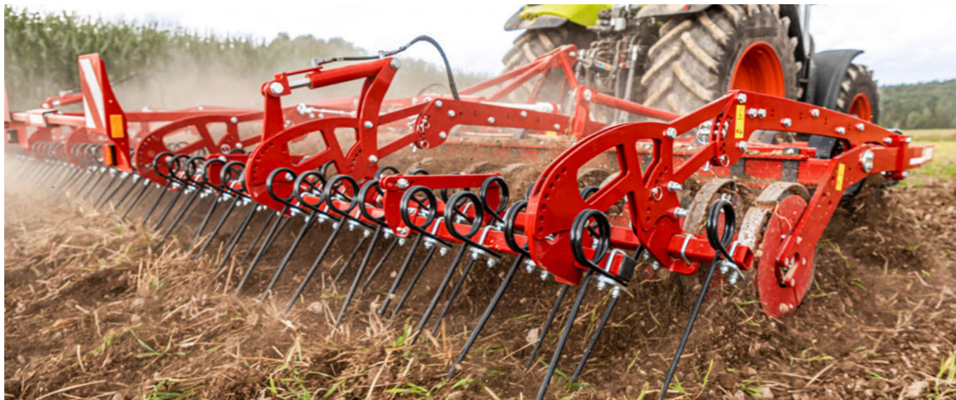
Rangée de herse double avec réglage hydraulique, en option