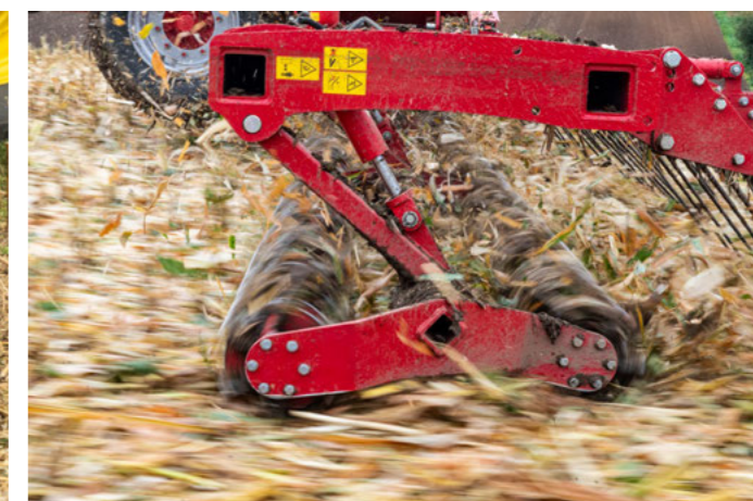
Dvojité nožový válec s teoretickou délkou řezu 14 cm