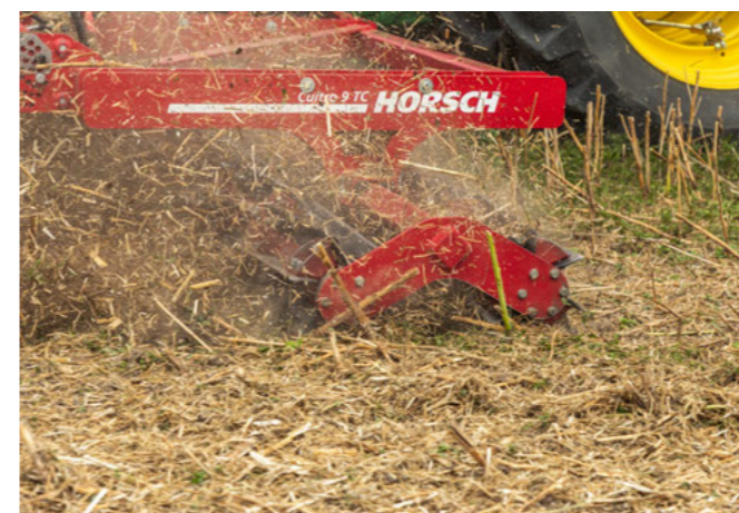
V pracovních záběrech od 3 do 18 m

V pracovní poloze spočívá celá hmotnost stroje na nožích, aby bylo dosaženo bezpečného řezu i za nejtěžších podmínek. Spektrum použití Cultro zahrnuje drčení meziplovin, řepky, slunečnice, kukuřice a distribuce slámy pomocí volitelného těžkého prutového segmentu. Kromě toho lze Cultro v kombinaci s Jokerem použít k přípravě seťového lůžka, nebo k zapravení velkého množství organické hmoty. Protiběžně uspořádané nožové nástroje vytvářejí křížový pracovní vzor se spolehlivým drčením organického materiálu. Díky malému průměru 300 mm a šesti nožům na válec je dosaženo vysoké rotační rychlosti, což dále zesiluje drticí efekt. Diagonální uspořádání nožů zajišťuje konstantní přenos síly. Toto uspořádání také zabraňuje rozkmitání stroje. Pro nejvyšší stabilitu a provozní bezpečnost jsou nože umístěny přímo na rotoru. Pro zajištění optimálního přizpůsobení povrchu jsou dvojité nožové prvky připevněny k rámu pomocí gumových bloků. To umožňuje přizpůsobení se případným nerovnostem terénu a chrání nožový válec před přetížením. U Cultro 12 a 18 TC si může zemědělec vybrat mezi pěchem RingFlex a těžkými prutovými bránami. U stroje Cultro 3 TC je v zadním závěsu možný RollFlex, nebo RollPack pěch. Tímto lze stroj optimálně přizpůsobit příslušným podmínkám nasazení.