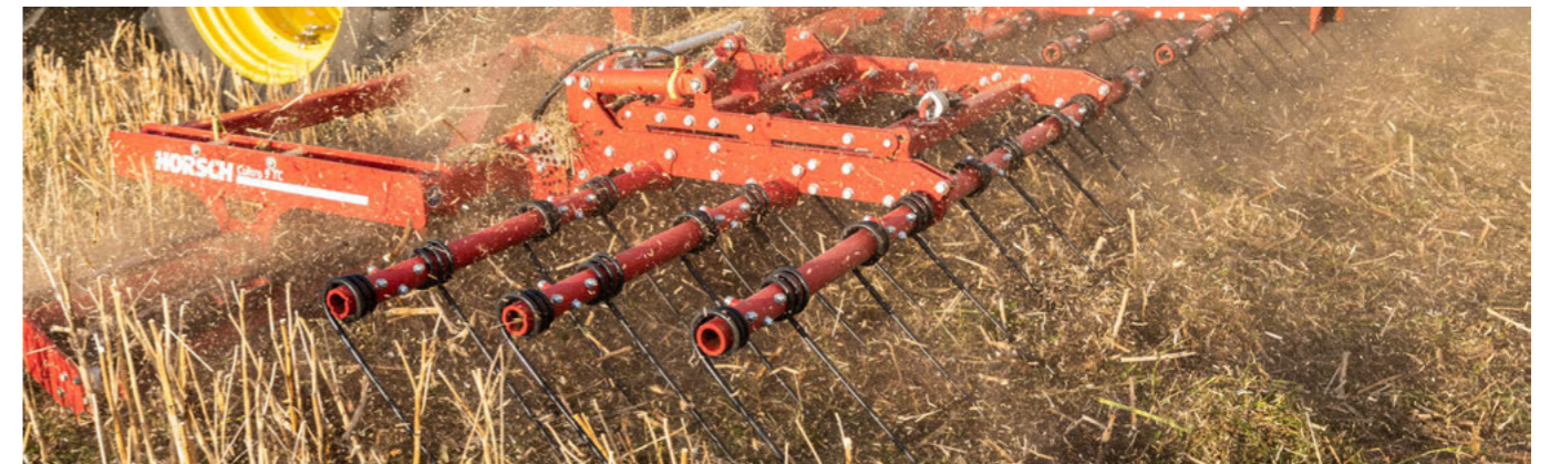
Volitelně s 3-řadými těžkými prutovými bránami pro tvorbu jemné struktury a rozprostření organické hmoty